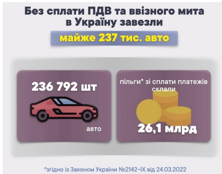
Рис. 2. Результати застосування т. зв. «нульового» митного оформлення транспортних засобів, що ввозилися громадянами на митну територію України у квітні–червні 2022 р.