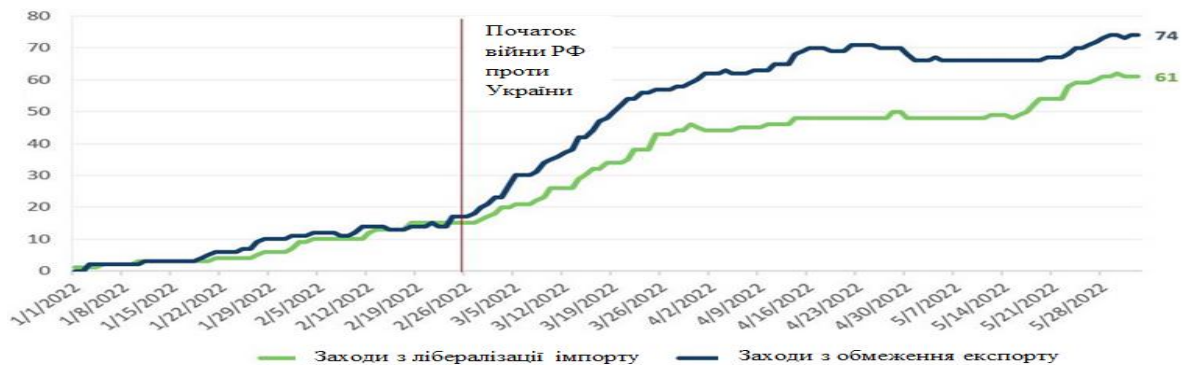
Рис. 3. Кількість поточних заходів торговельної політики

Не менш важким наслідком війни РФ проти України, що загострює світову продовольчу кризу, є введення країнами протекціоністських заходів – обмежень на експорт сільськогосподарської продукції, які посилюють дефіцит продовольства та підвищують ціни на харчові продукти. Так, за даними Світового банку на 2 червня 2022 р. 34 країни (РФ, Казахстан, Індія, Туреччина та ін.) запровадили 74 заходи торговельної політики, що обмежують експорт сільгосппродукції та мінеральних добрив, з них дві третини – повна заборона експорту (Рис. 3).