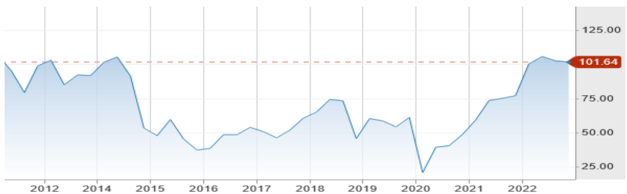
Рис. 2. Котирування ф'ючерсів на нафту марки WTI (серпень 2022 р.) на Нью-Йоркській товарній біржі, дол. США за барель