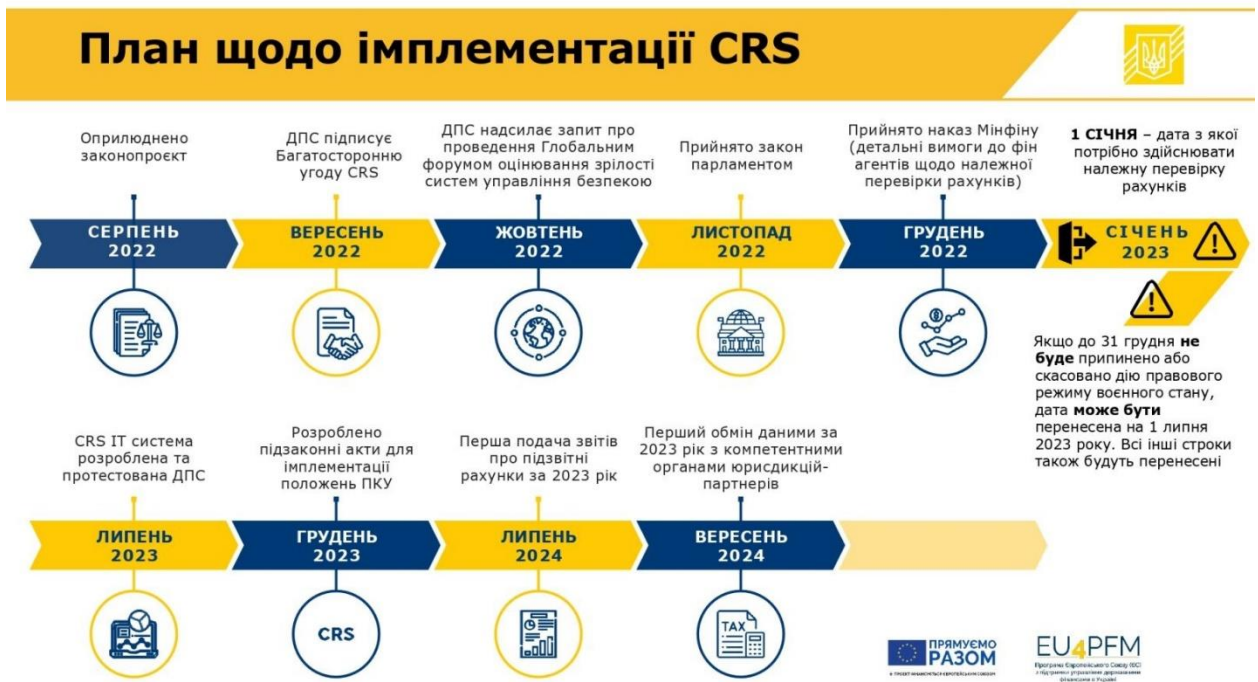
Рис. 2. План імплементації Загального стандарту звітності CRS в Україні (станом на серпень 2022 р.)