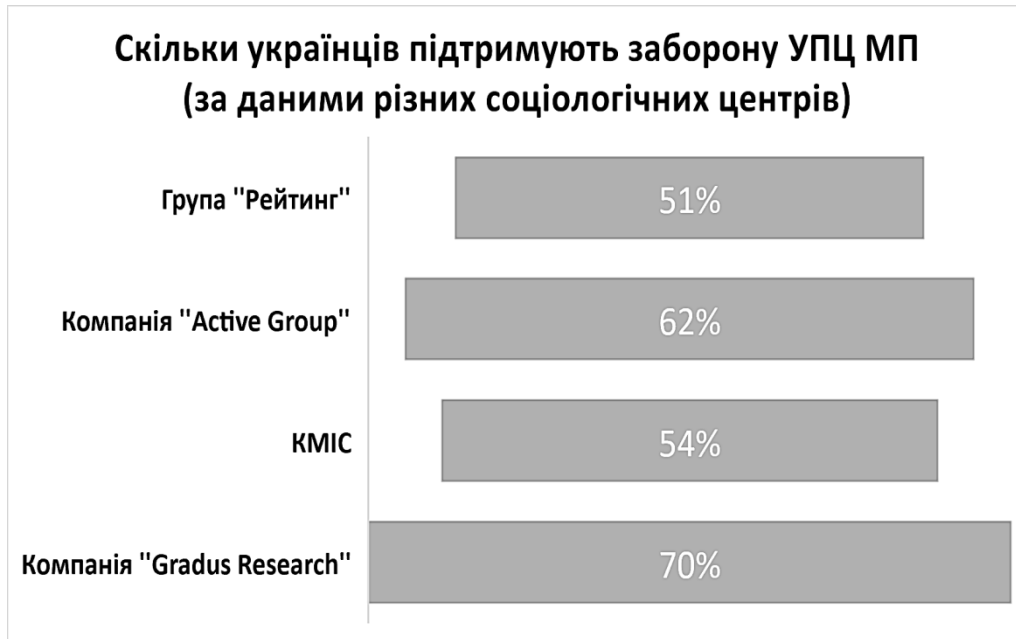
Рис. 2. Дані соціологічних досліджень, що стосуються підтримки заборони діяльності УПЦ МП