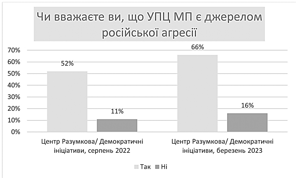
Рис. 3. Дані соціологічних опитувань щодо ставлення до УПЦ МП як до джерела російської агресії в 2022–2023 рр.

У березні 2023 р. Фонд «Демократичні ініціативи» та Центр Разумкова реалізували ще один спільний проєкт – «Символи, події та особистості, які формують національну пам'ять про війну з Росією». Респондентів, зокрема, запитали, чи погоджуються вони з тим фактом, що УПЦ МП сприяла російській агресії (рис. 3). Категорично ствердну відповідь на це запитання дали 40 % опитаних, іще 26 % вибрали опцію «скоріше згоден, ніж не згоден» 33 . Отже, сумарний показник становив 66 %. Наприкінці літа 2022 р. він був на 14 % меншим.