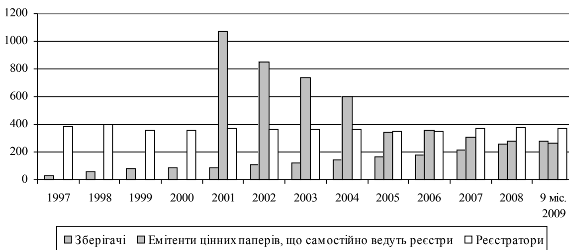
Рис. 1. Динаміка показників нижнього рівня депозитарної системи України, одиниць

Нижній рівень депозитарної системи представлений 369 реєстраторами і 282 зберігачами, 262 емітенти самостійно ведуть реєстри цінних паперів. Розвиток ринків капіталу в Україні, збільшення обсягів укладених угод на ринку цінних паперів зумовили утвердження на фінансовому ринку бездокументарної форми існування цінних паперів і відповідне виникнення потреби у збільшенні кількості зберігачів. Як наслідок, кількість реєстраторів за 1997 р. – 9 міс. 2009 р. скоротилась з 387 до 369, тоді як кількість зберігачів зросла вдвідесятеро (рис. 1).