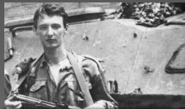
Игорь Стрелков (Гиркин) 1992 – приднестровский «казак» Апрель 2014 – возглавил группу военных, захвативших Славянск. «Министр обороны» т.н. ДНР