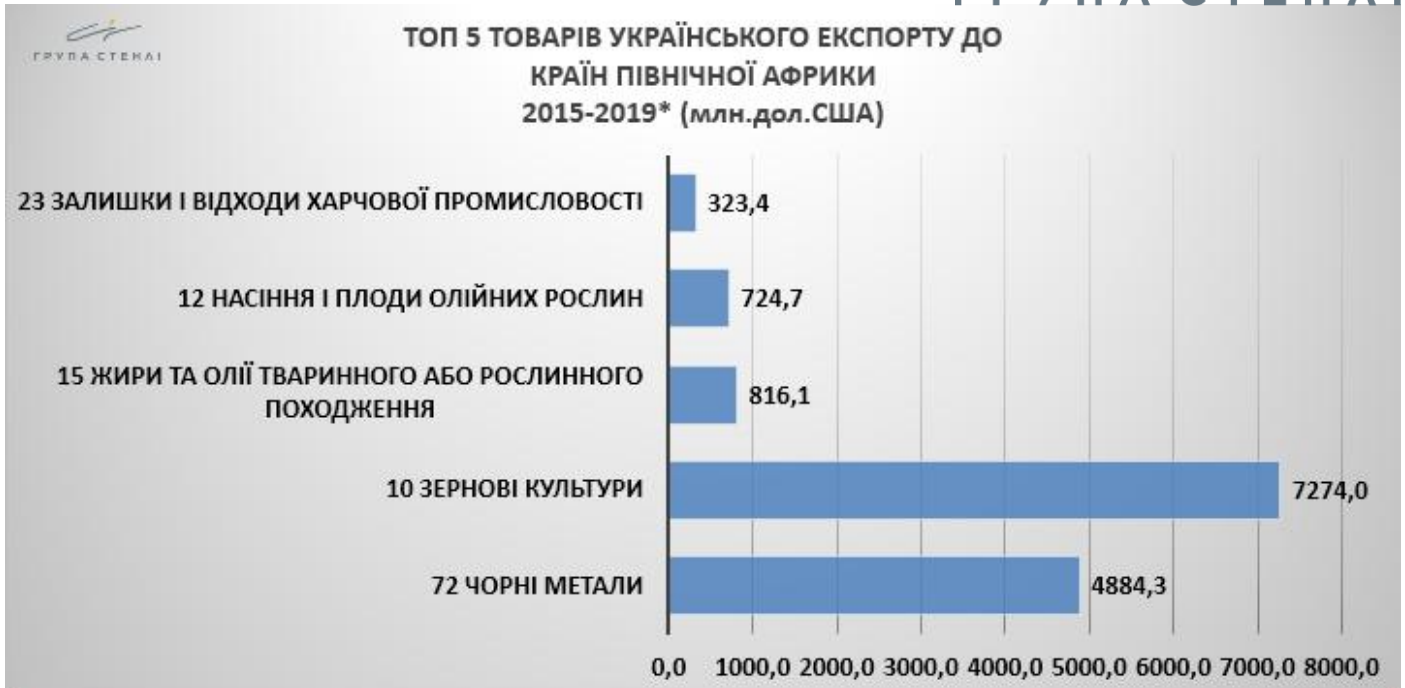
ТОП 5 ТОВАРІВ УКРАЇНСЬКОГО ЕКСПОРТУ ДО КРАЇН ПІВНІЧНОЇ АФРИКИ