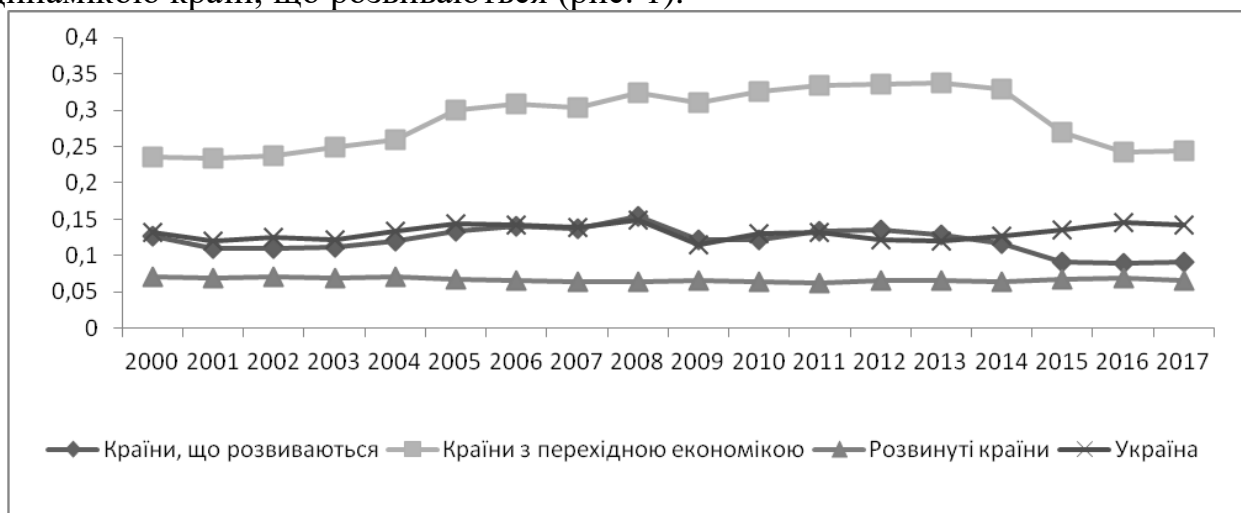
Рис. 1. Динаміка коефіцієнту концентрації товарного експорту України та різних груп країн світу за рівнем розвитку, 2000-2017 рр.

Аналіз рівня концентрації товарного експорту України, здійснений на рівні трьохзначних кодів класифікації товарів за міжнародною системою SITC (rev. 3), свідчить, що тенденції концентрації українського експорту значно відрізняються від тих, що мають місце в інших країнах з перехідною економікою та розвинутих країнах, найбільшою мірою корелюючи при цьому з динамікою країн, що розвиваються (рис. 1).