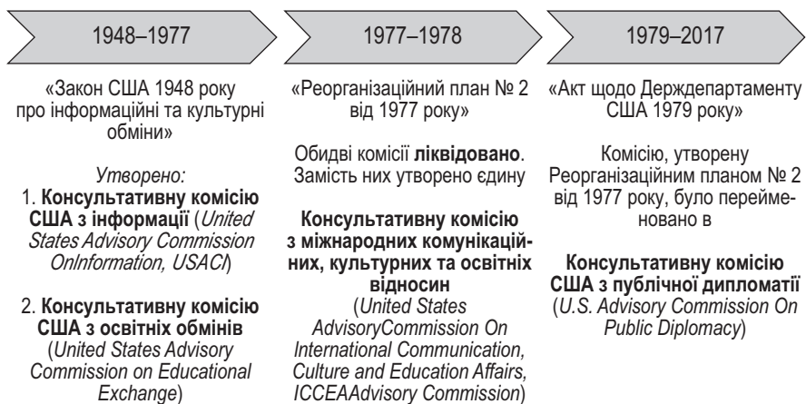
Рис 2.1. Хронологія змін в організаційній структурі наглядових органів у сфері ПД США у 1948–2017 рр.