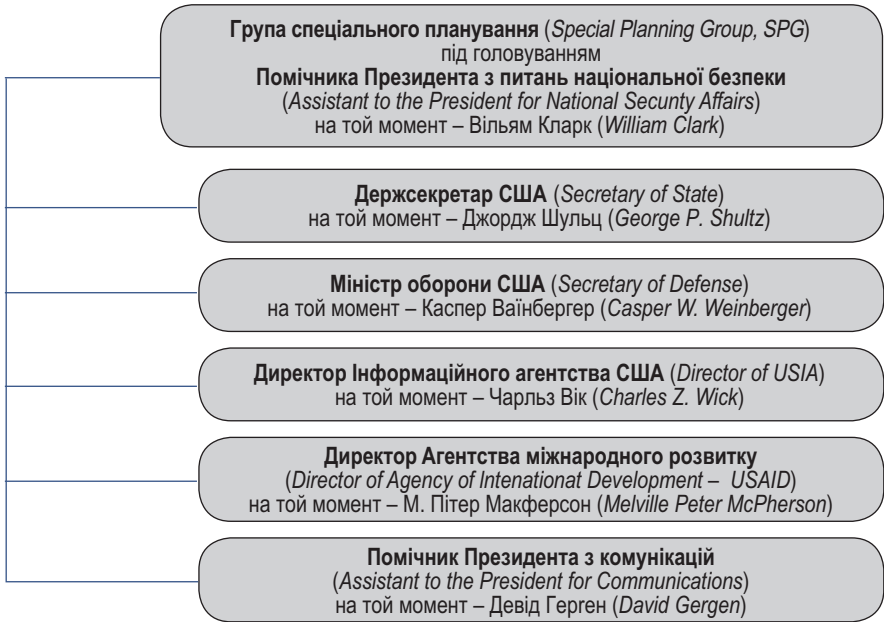
Рис 4.1. Члени Групи спеціального планування, створеної відповідно до NSDD-77

До зони відповідальності ГСП було віднесено: