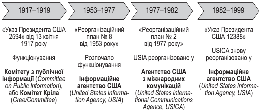
Рис 2.2. Ключові зміни у структурі організаційних органів США, відповідальних за реалізацію ПД

USICA проіснувала до жовтня 1982 р., коли Р. Рейган Указом ( Executive Order ) 12388 постановив перейменувати USICA знов у USIA , не змінюючи її повноважень [66]. Майже за рік до цього, він змінив керівника USICA – ним став Чарльз Вік ( Charles Z. Wick ), який перебував на посаді з 1981 р. по 1989 р. У 1999 р. функціональні обов'язки USIA розподілено між кількома структурами. Все, що стосувалося мовлення, відійшло до новоствореної Ради директорів BBC ( Broadcasting Board of Governors ), а питання обмінів та інформаційних заходів, не пов'язані безпосередньо з мовленням, відійшли до компетенції заступника Держсекретаря з публічної дипломатії та публічних відносин.