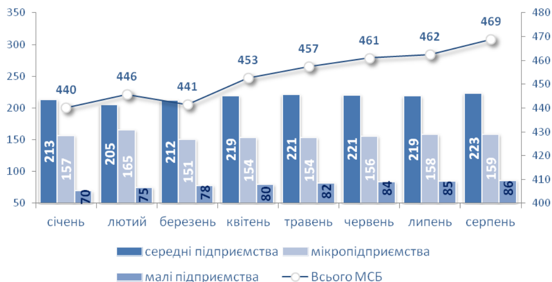
Рис.4. Динаміка зміни кредитів, наданих депозитними корпораціями (крім Національного банку України) нефінансовим корпораціям, за розміром суб'єкта господарювання: мікро-, малого та середнього бізнесу в січні-серпні 2021 року.