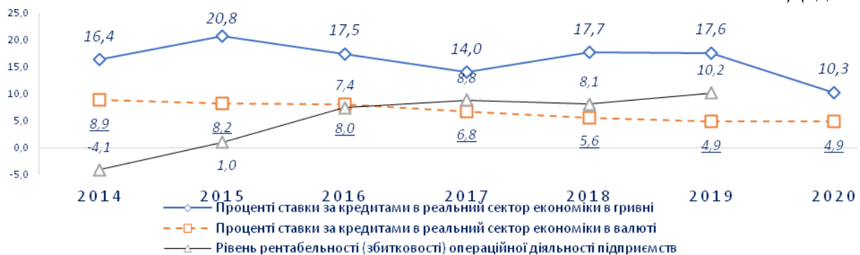
Рис.2. Процентні ставки за кредитами та рівень рентабельності (збитковості) операційної діяльності підприємств у 2014 – 2019 рр., %