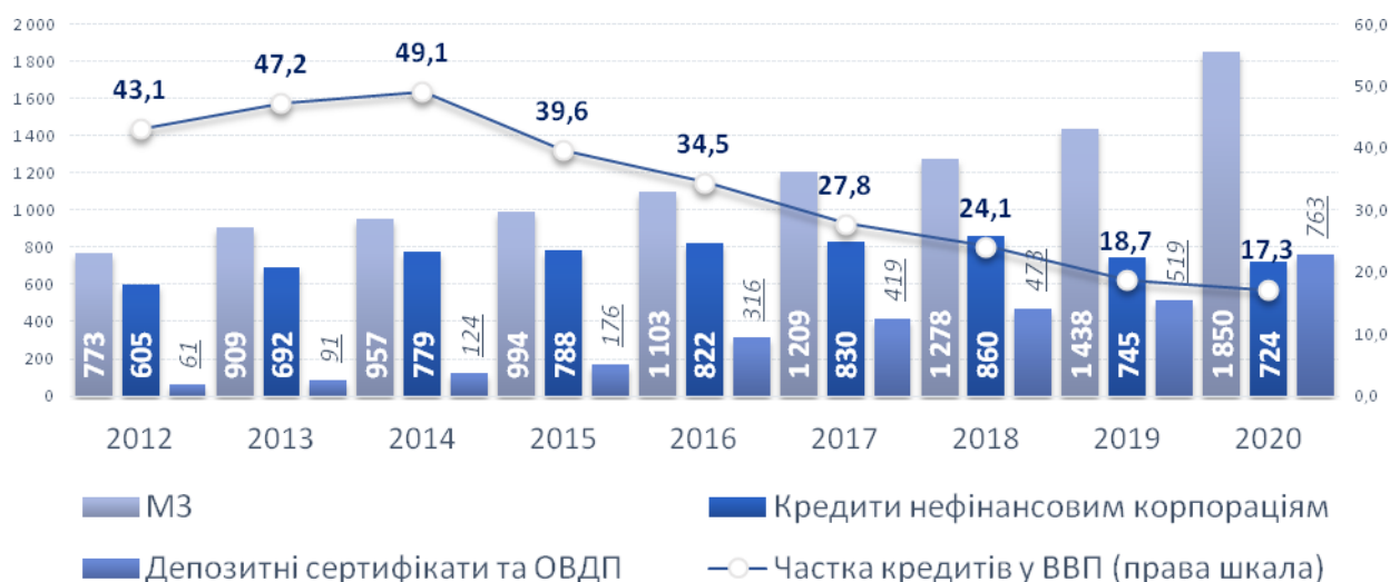
Рис.3. Зміна напрямку кредитування реального сектору на придбання депозитних сертифікатів НБУ та ОВДП у 2012 – 2020 рр., млрд грн та %