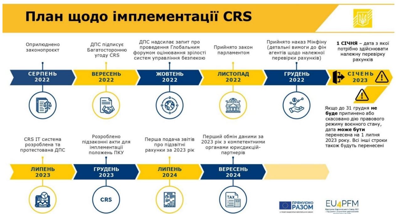
Рис. 2. План імплементации Загального стандарту звітності CRS в Україні (станом на серпень 2022 р.)