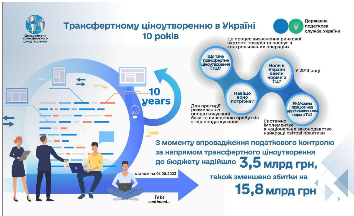
Рис. 2. Результати податкового контролю за трансфертним ціноутворенням у 2013–2023 рр.

Плану BEPS , правил GAAR , концентрації напрямів ТЦ, контролю за діяльністю нерезидентів, контрольованих іноземних компаній, пасивних доходів у єдиний ефективний інструмент контролю за правилами міжнародного оподаткування. Протягом десятирічного періоду формування законодавчої бази з трансфертного ціноутворення ДПС проводила аналітичну роботу та контрольні-перевірочні заходи, які дали змогу забезпечити значні результати (рис. 2).