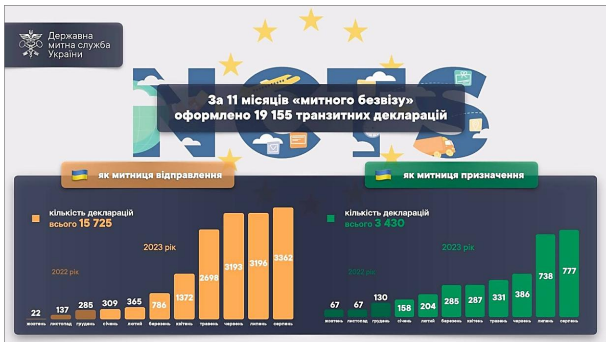
Рис. 3. Дані про застосування «митного безвізу» за період із 01 жовтня 2022 р.

Держмитслужба підбила підсумки за 11 місяців «митного безвізу». З 01 жовтня 2022 р. оформлено понад 19 тис. транзитних декларацій у Новій комп'ютеризованій транзитній системі ( New Computerized Transit System, NCTS ). Загалом за 11 місяців зареєстровано 15 725 переміщень з України. Зокрема, у серпні 2023 р. в країнах – учасницях Конвенції про процедуру спільного транзиту було завершено 3362 переміщення, розпочатих в Україні. З початку міжнародного застосування NCTS за 3430 деклараціями спільного транзиту товари були успішно доставлені до митниць призначення на митній території України. Зокрема, у серпні 2023 р. було зафіксовано 777 таких декларацій (рис. 3). Також станом на кінець серпня 2023 р. підприємствам надано 72 авторизації на застосування транзитних спрощень. Понад 30 заяв від підприємств перебувають на різних етапах розгляду. Так пошавляється процес отримання та використання бізнесом митних спрощень.