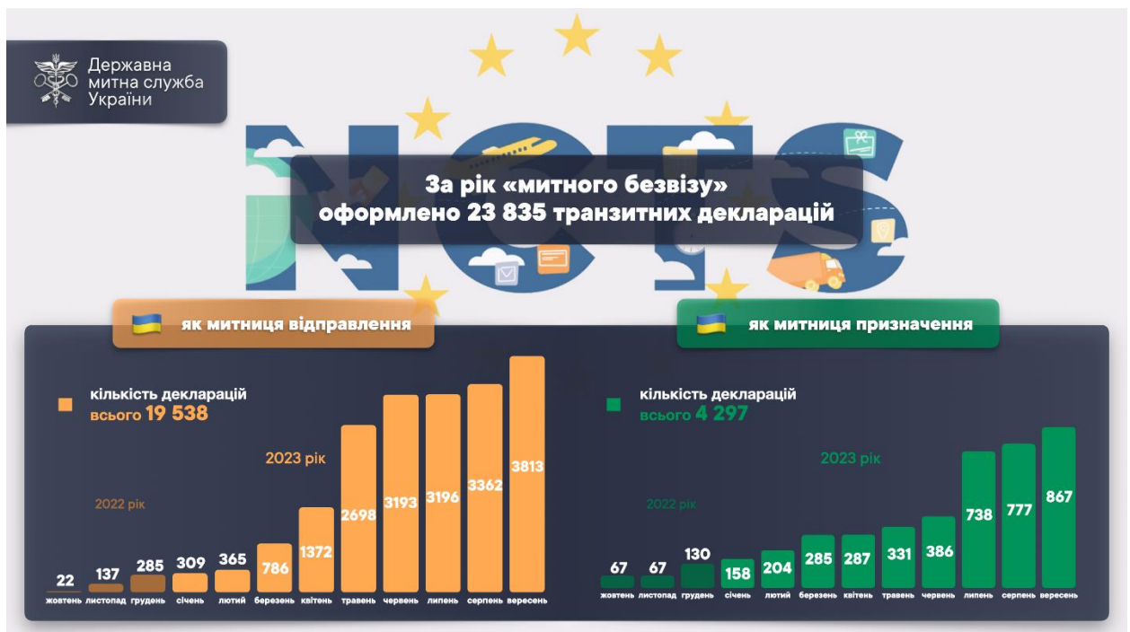
Рис. 3. Динаміка оформлення транзитних декларацій у системі NCTS під час «митного безвізу» за період із 01 жовтня 2022 р. по 01 жовтня 2023 р.

У контексті подальшого розширення застосування NCTS Держмитслужба активно залучає підприємства для надання авторизації на застосування транзитних спрощень відповідно до Конвенції. Так, уже надано 85 авторизацій на застосування транзитних спрощень. Понад 40 заяв від підприємств перебувають на різних етапах розгляду.