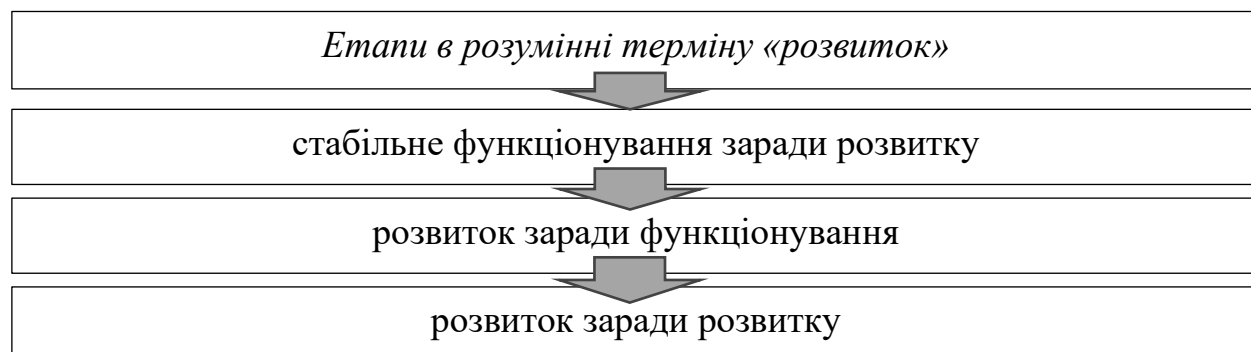
Рис. 1. Етапи в розумінні терміну «розвиток».

В економічній літературі розвиток раніше розглядався у контексті того, що підприємство здійснює стабільно свою діяльність, отже, розвиток сприймався як похідна від здійснення господарської діяльності й наслідок стабільного його функціонування. Таким чином, можна зробити висновок про такі етапи в розумінні терміну «розвиток» (рис. 1).