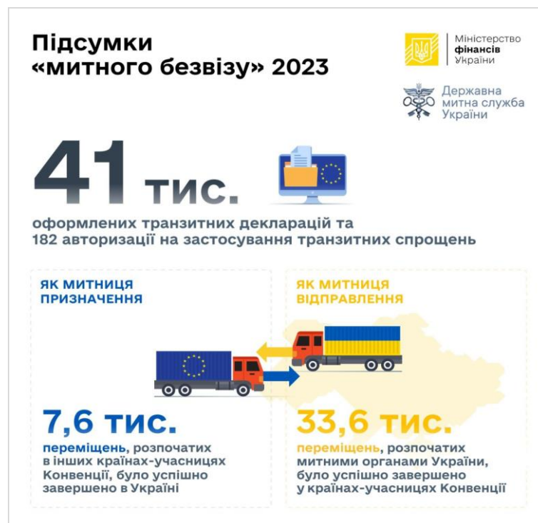
Рис. 3. Підсумки «митного безвізу» у 2023 р.

Держмитслужба підбила підсумки «митного безвізу» в 2023 р. Протягом 2023 р. у країнах – учасницях Конвенції про процедуру спільного транзиту було успішно завершено більше 33,6 тис. переміщень, розпочатих митними органами України. Водночас в Україні успішно завершено більше 7,6 тис. переміщень, розпочатих в інших країнах – учасницях Конвенції. Загалом за цей період оформлено 41 тис. транзитних декларацій (рис. 3), а після розпочатого 1 жовтня 2022 р. використання міжнародного застосування Україною NCTS ( New Computerized Transit System ) – 41,9 тис. декларацій.