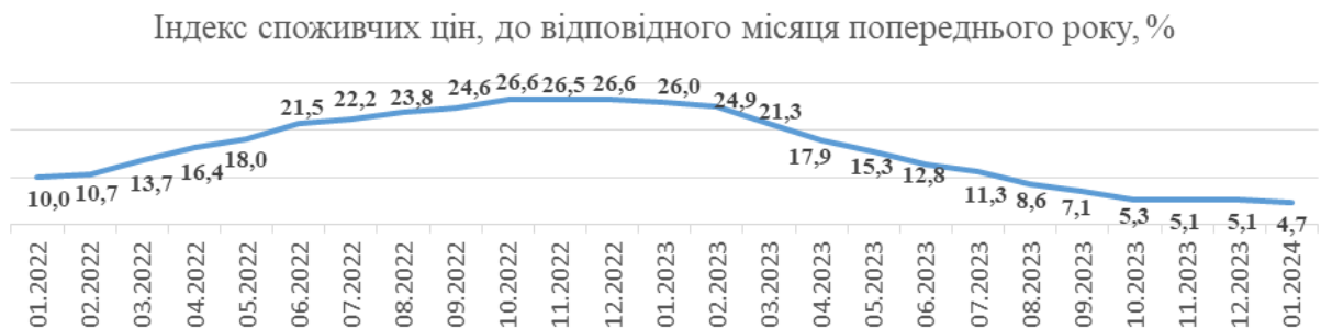
Рис. 1. Індекс споживчих цін, до відповідного місяця попереднього року, %

Рівень інфляції в Україні знижується тринадцятий місяць поспіль 1 . За даними Державної служби статистики України, у січні 2024 р. споживча інфляція в річному вимірі (р/р) знизилася до 4,7 %. У місячному вимірі (відносно грудня 2023 р.) ціни зросли на 0,4 % (рис. 1).