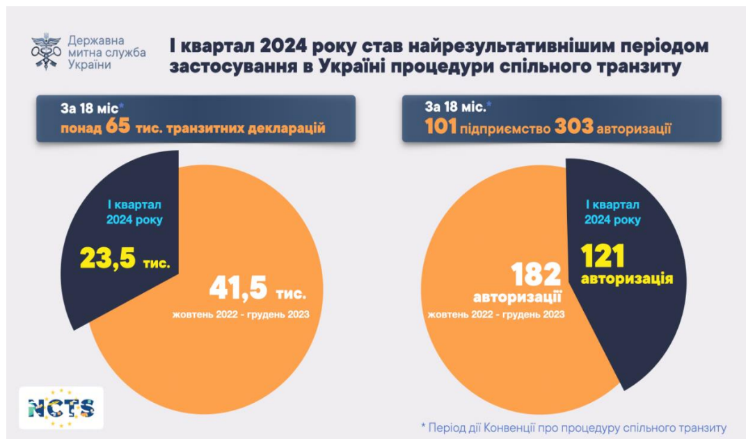
Рис. 2. Результати застосування процедури спільного транзиту в І кварталі 2024 р.