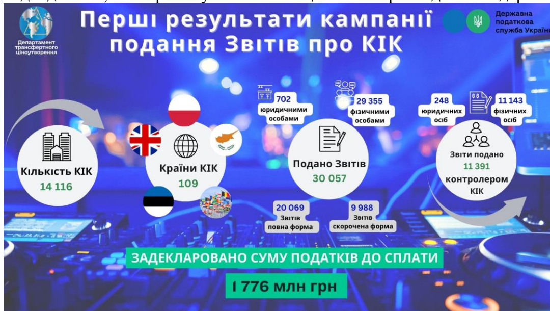
Рис. 2. Результати кампанії подання контролюючими особами Звітів про контрольовані іноземні компанії

Отже, завдяки міжнародному інструменту звітування про КІК для протидії мінімізації оподаткування, державний бюджет України отримує додаткові надходження, які спрямовуються на зміцнення обороноздатності держави.