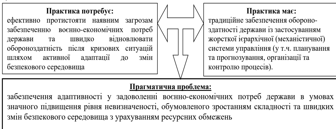
Рис. 1. Зміст прагматичної проблеми дослідження забезпечення воєнно-економічної стійкості держави

Наявність цього протиріччя актуалізує необхідність вирішення практичної проблеми формування адаптивності у забезпеченні воєнно-економічних потреб держави в умовах значного підвищення рівня невизначеності, обумовленого зростанням ступеня складності та швидких змін безпекового середовища з урахуванням ресурсних обмежень держави (рис. 1).