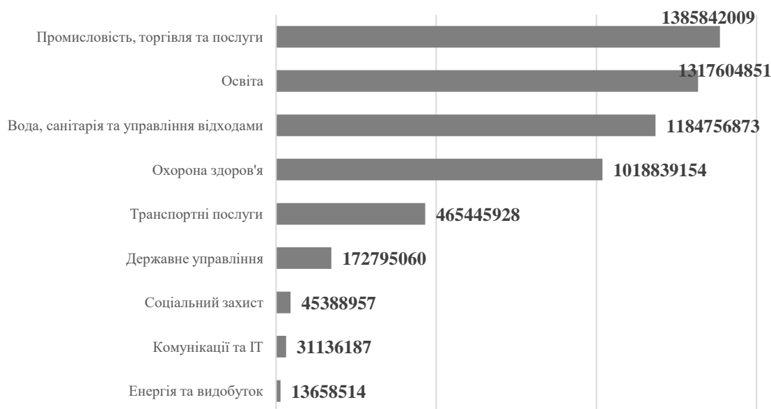
Рис. 3. Найвне фінансування актуальних цільових проектів, що реалізують громади Луганської, Донецької, Запорізької, Херсонської областей у 2024 р., за сферами реалізації, млн грн

Водночас, інфографіка з наявного фінансування цільових проектів, що реалізуються у чотирьох областях (Донецька, Луганська, Запорізька Херсонська), виглядає наступним чином (рис. 3):